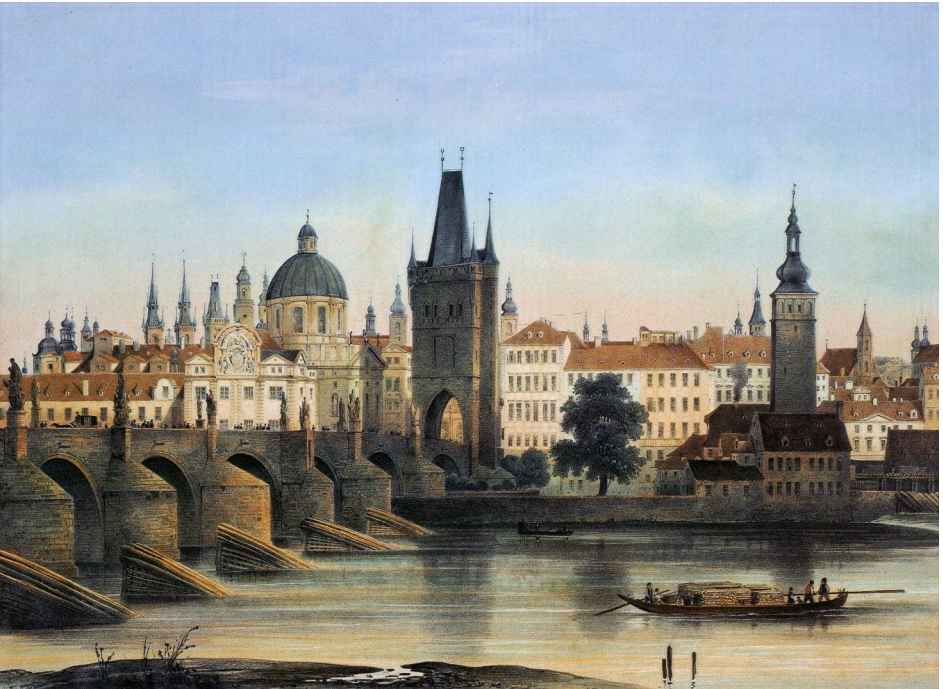
Karlsbrücke, Prag, von Franz Xaver Sandmann, 1840

Prag - Hauptstadt von Tschechien mit heute 1,26 Mio. Einwohnern